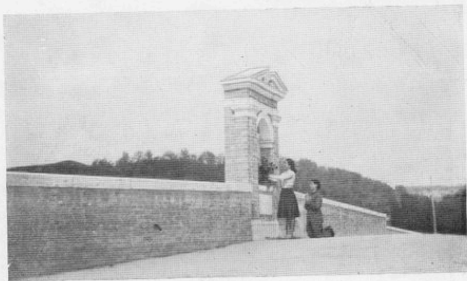
Omaggio floreale alla Madonna del Ponte del Garbo