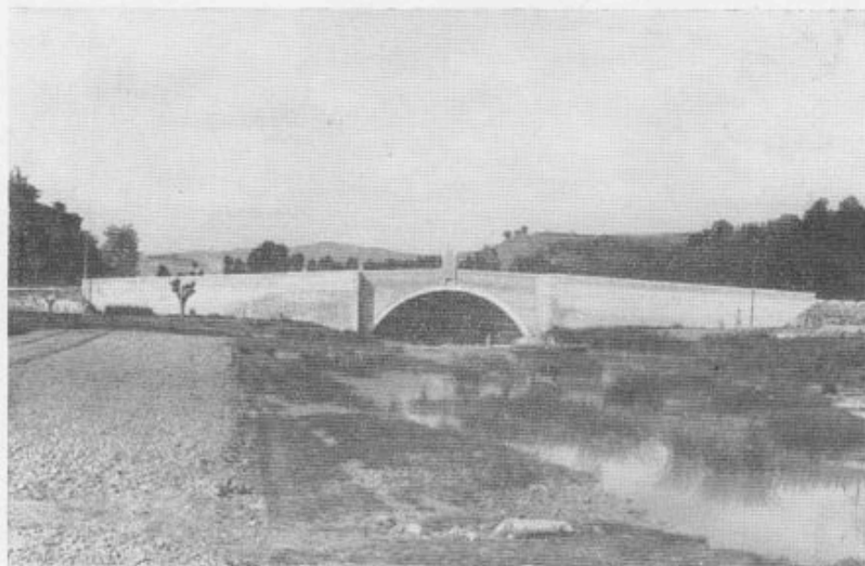
Il Ponte del Garbo ricostruito