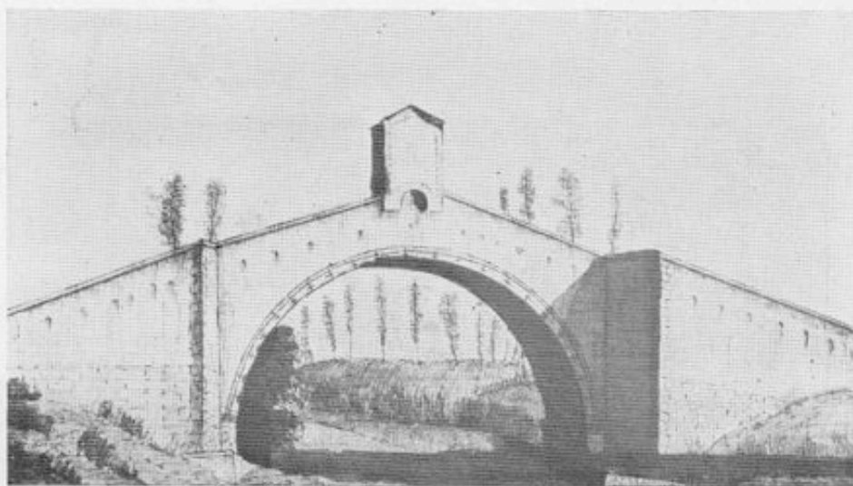
Il Ponte del Garbo nel Sec. XVIII

(Disegno a penna di Ettore Romagnoli nella Biblioteca Comunale di Siena)