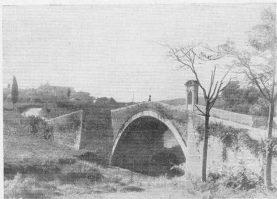
Il Ponte del Garbo prima della distruzione del giugno 1944