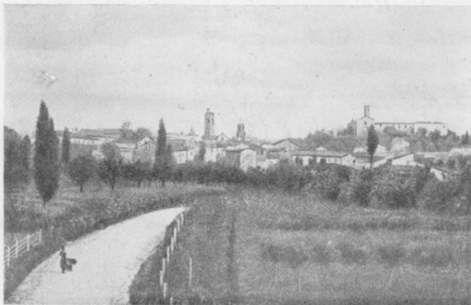
Panorama di Asciano