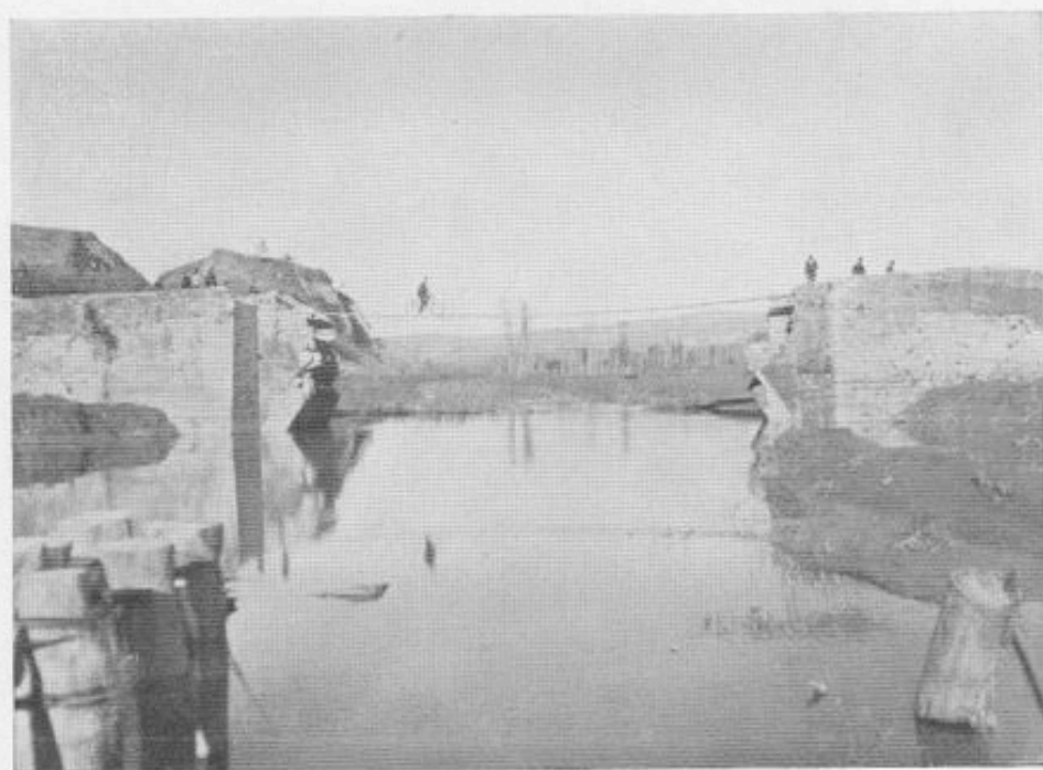
Il Ponte del Garbo dopo la distruzione