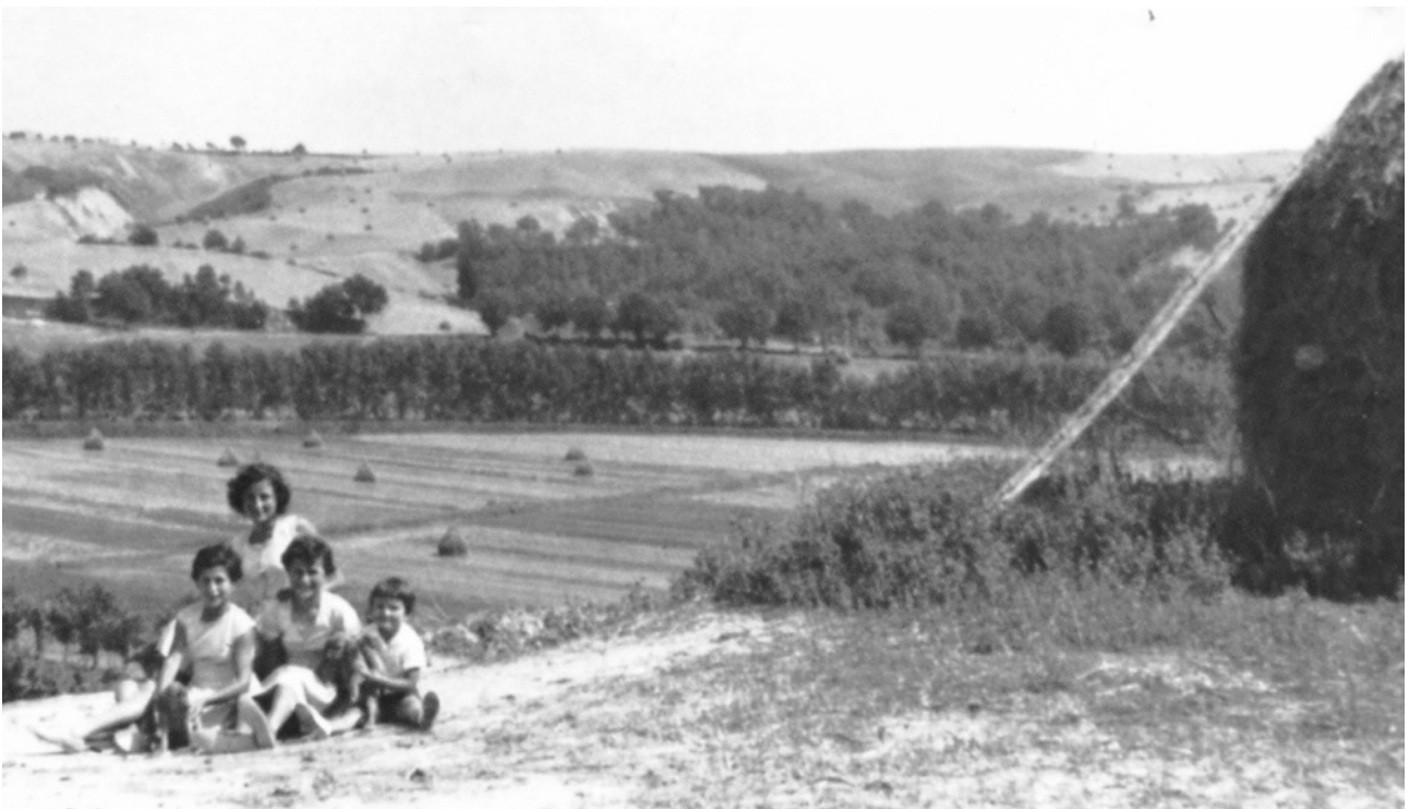
I campi di Torrentino, con le mucchie, subito dopo la segatura